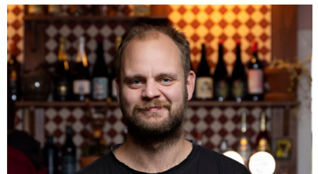
Stortingsrepresentant: Mímir Kristjánsson.