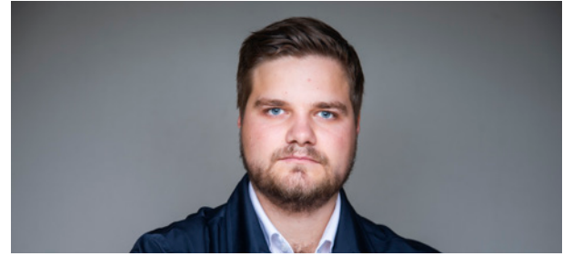
Stortingsrepresentant: Tobias Drevland Lund.