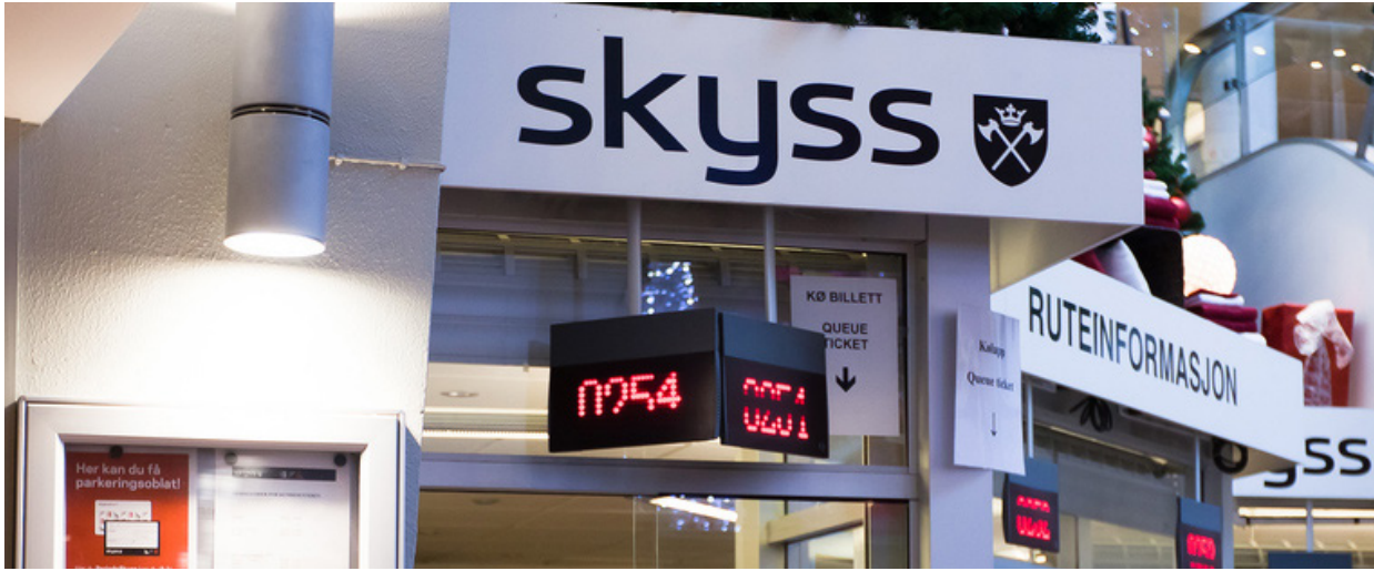
Bør bli gratis: Rødt vil ha gratis kollektivtransport i Bergen.